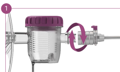
Assemblez ICE à sa chemise interne