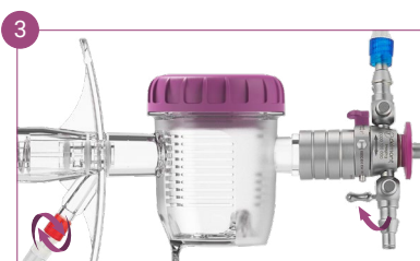
Fermez le robinet et déplacez la tubulure d'aspiration à l'arrière de l'activateur